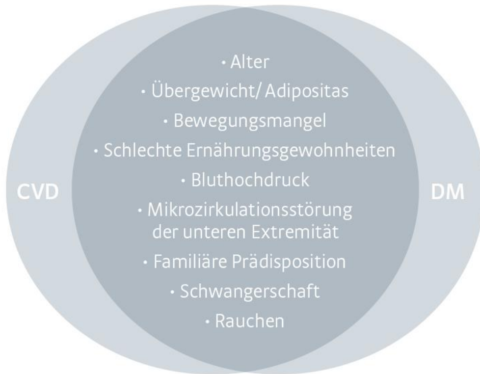
gemeinsame Risikofaktoren von CVD und DM

Auch mit Blick auf die Pathophysiologie sind viele Gemeinsamkeiten zu beobachten. So ist die Koexistenz von CVD und DM häufig mit Schäden an den Gefäßwänden und endothelialer Dysfunktion assoziiert, was mit Beeinträchtigungen der mikrovaskulären Permeabilität und des lymphatischen Flusses einhergehen kann. Entsprechende Stauungen und Störungen des Gefäßsystems können die Entstehung einer Venenthrombose begünstigen oder zu Gewebhypoxie und Wundheilungsstörungen führen, die sich in Form von Ödemen, Hautveränderungen und Ulcera ausbilden können (Abbildung 2). [4]