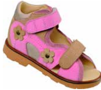
Abb. 7: Antivarussandale