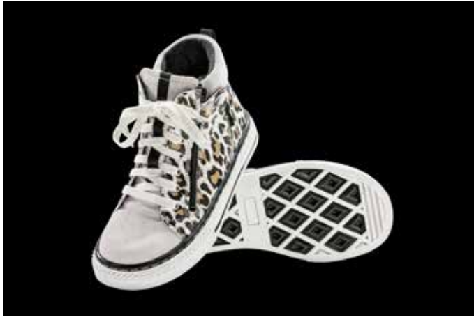
Abb. 23: Stabilschuh zur Stabilisierung des Sprunggelenks