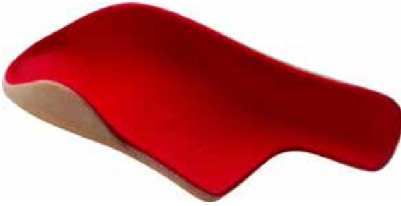
Abb. 12: Einlage mit Drei-Punkt-Korrektur