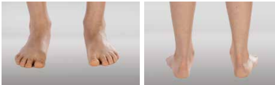
Abb. 15 und Abb. 16: Kindlicher Knick-Senkfuß