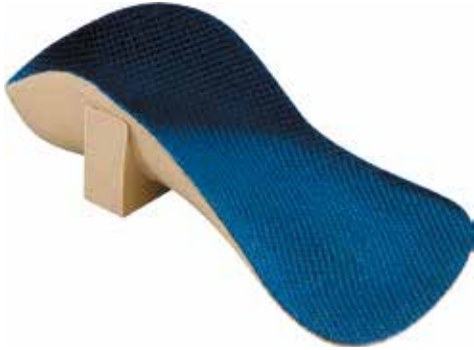
Abb. 19: Langsohlige korrigierende Schaleinlage

bzw. neurologische Einlage bekannten Konzept steckt die Überzeugung, dass mit Hilfe gezielter Stimulation eine gestörte Bewegungskoordination verbessert werden kann. Die Propriozeption (Eigenwahrnehmung) umfasst die auf körpereigene Reize ansprechenden Sinnesorgane zur Wahrnehmung der Stellung, Bewegung und Orientierung des Körpers und seiner Glieder und Gelenke zueinander. So sollen sensomotorische Einlagen beispielsweise helfen, eine schwache Muskulatur zu stimulieren oder eine hyperaktive Muskulatur zu kontrollieren. Dadurch können Dysbalancen der Muskulatur – und damit auch Beschwerden in Haltung, Stellung, Gleichgewicht und Koordination – gezielt behandelt werden.