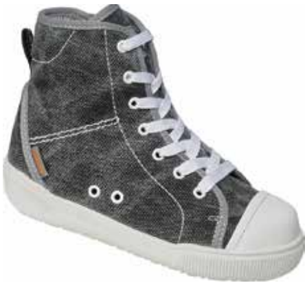
Abb. 29: Stabilschuh zur Führung und Unterstützung des Sprunggelenks

eine feste Fersenkappe verfügen und knöchelumschließend oder knöchelübergreifend sein, insbesondere bei jüngeren Kindern. Bei älteren Kindern ist ein Halbschuh möglich, der aber mindestens über eine Fersenkappe verfügen und fest am Fuß fixiert werden muss, damit Fuß, Schuh und Einlage eine funktionelle Einlage bilden. Des Weiteren sollte der Schuh über einen weichen Vorfuß mit flexibler Sohle verfügen.