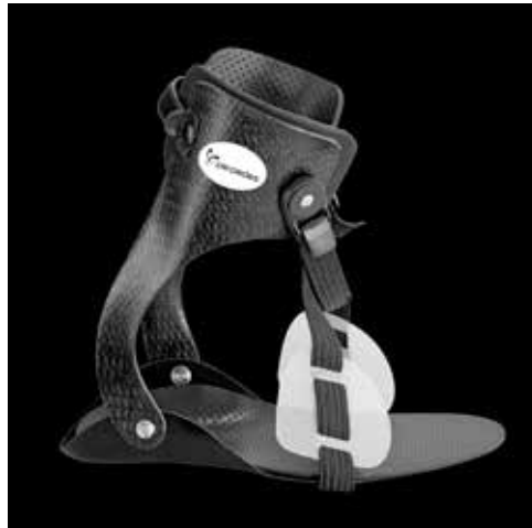
Abb. 31: Orthese

Hier unterscheidet man passive Orthesen (z. B. Nachtlagerungsorthesen) zur Wachstumslenkung und aktive, dynamische Orthesen, die in der Regel während des Tages genutzt werden. Sie können über Gelenke oder Carbonfedern verfügen, um die Gelenkbeweglichkeit zu ermöglichen. Auch sogenannte Quengelorthesen können eingesetzt werden, die über einen dynamischen Zug oder über eine dynamische Krafteinheit im Orthesengelenk für eine kontinuierliche Dehnung der zur Verkürzung neigenden Muskulatur sorgen (Kontrakturbehandlung und -prophylaxe).