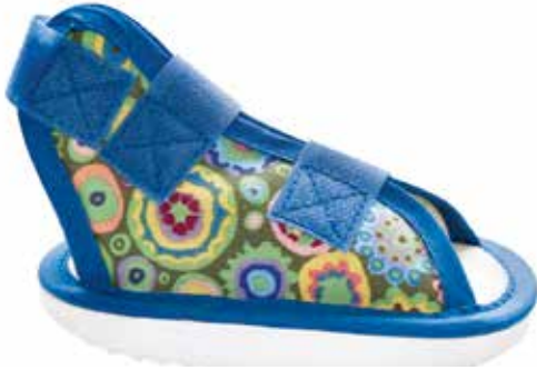
Abb. 10: Kindergipsschuh zur postoperativen Versorgung des kindlichen Fußes