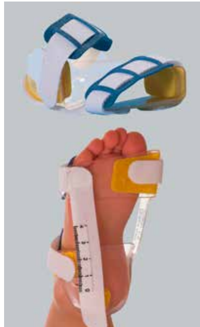
Abb. 11: Sichelfußorthese

Ebenso wie bei der korrigierenden Nachbehandlung des Klumpfußes (siehe Kapitel 1) empfiehlt sich aufgrund der hohen Rezidivneigung des Sichelfußes eine Versorgung mit Antivarusschuhen oder korrigierenden Einlagen, die nach dem Drei-Punkt-Prinzip wirken. Wichtig ist dabei, dass das Schuhwerk einlagengerecht ist (Stabilschuh) und dass Einlage und Schuh eine Einheit bilden. Arzt und Orthopädie-Handwerker müssen den korrekten Sitz der Einlage überprüfen.