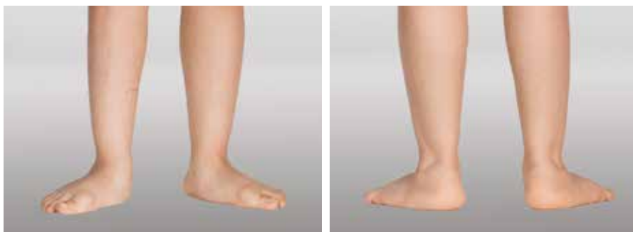
Abb. 17 und Abb. 18: Starker kindlicher Knick-Senkfuß