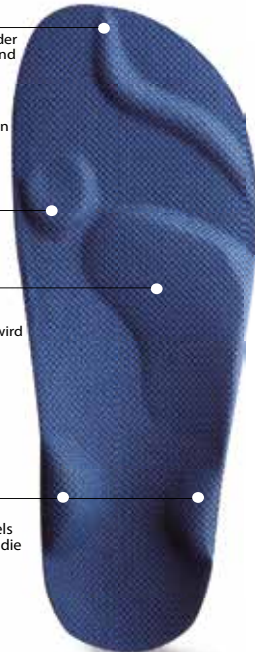
Abb. 20: Erläuterung Pelotten

Steuern die Ausrichtung des Rückfußes und des Sprunggelenks über die Schienbein- und seitliche Wadenmuskulatur. Durch Stimulierung des sogenannten muskulären Steigbügels wird die Muskelreaktionszeit und das Verletzungsrisiko im Sprunggelenk reduziert. Über die Fußreflexzonen wird die Beckenmuskulatur angesprochen.