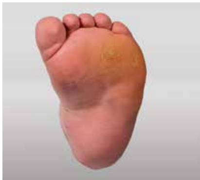
Abb. 2: Kongenitaler Klumpfuß Sohlenansicht