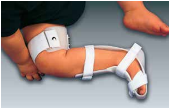
Abb. 4: Korrigierende Klumpfußnachtschiene