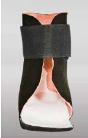
Abb. 30: Innenschuh

Der Innenschuh kommt dann zum Einsatz, wenn initiale Strukturveränderungen am Fuß vorliegen oder aber die Tonusverhältnisse so verändert sind, dass nur mit größerer Kraft die Korrekturstellung des Fußes sichergestellt werden kann. Ein Inneschuh wird nach Gipsabdruck und Leisten gefertigt. Er ist in Verbindung mit Konfektionsschuhen und in der Sommerzeit mit Konfektionssandalen zu nutzen. Ganz allgemein muss jedoch beim Einsatz von Konfektionsschuhen darauf geachtet werden, dass dabei die Sohle breitbasig gestaltet, im Vorfuß flexibel und der Sohlenrand scharfandig begrenzt ist, um so für eine größere Basis zu sorgen, auf der die Kinder ihren Körperschwerpunkt ausbalancieren können. Mehr Sicherheit führt zu weniger Spastik (Tonus), weniger Tonus zu mehr Mobilität und Kontrolle.