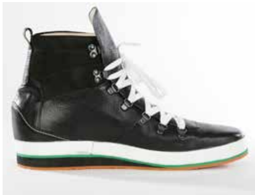
Abb. 34: Maßschuh

Der deutlich knöchelübergreifende hochschäftige Maßschuh ist eine Alternative zu einer Unterschenkelorthosenversorgung. Mit Hilfe der in der Schuhtechnik eingesetzten Materialien kann eine druckumverteilende Bettung erfolgen. Sie ermöglichen Punktentlastungen. Je nach Schafthöhe kann individuell auf die Tonusverhältnisse der Spastivität eingewirkt werden.