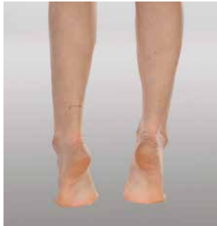
Abb. 26 und 27: Habituelle Zehenspitzen-gang .....