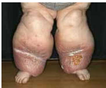
Lymphödem Stadium III (Elefantiasis)