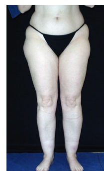
Abb. 1a: Lipödem Ausgangsbefund