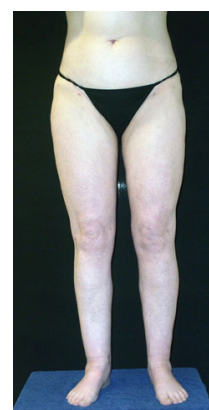
Abb. 1b: Zustand nach Entfernung von 14,3 Litern Fett an Hüften, Ober- und Unterschenkeln