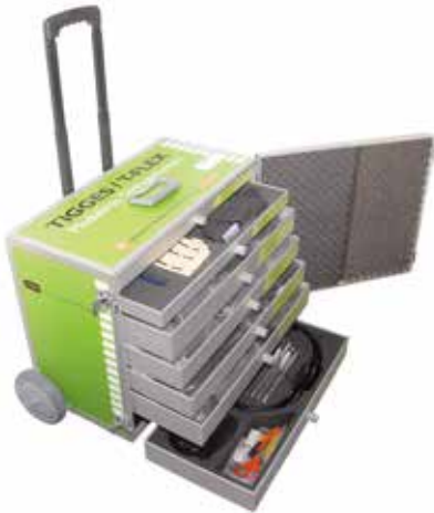
Beispiel eines modularen Orthesensystems mit Ab- und Aufbaufunktion

Je nach Indikation ist bei einigen Orthesen eine Abrüstung und somit zunehmende Mobilisierung möglich.