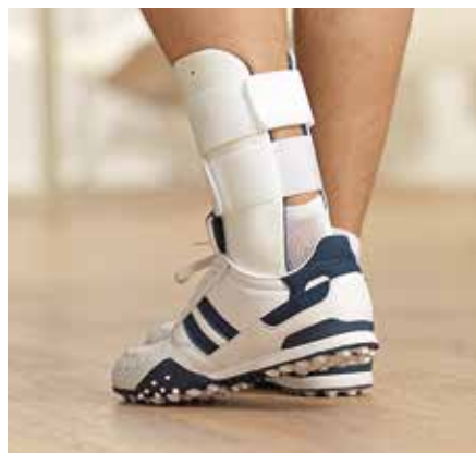
Sprunggelenkorthese zur Stabilisierung