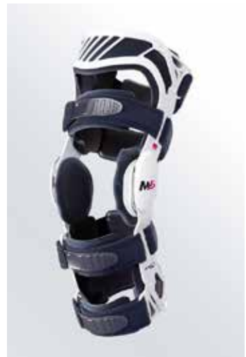
Rahmenorthese zur Stabilisierung des Kniegelenks

Kreuzbandrupturen werden sowohl prä- als auch postoperativ überwiegend