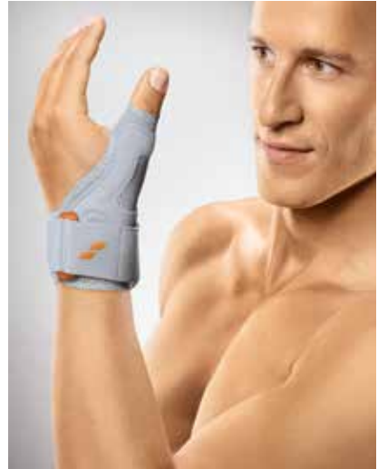
Daumenorthese zur Immobilisierung des Sattel- und Grundgelenks

Bei Daumen-/Fingerorthesen sind dies die Interphalangeal- sowie die Sattel- und/oder Grundgelenke, wobei Verletzungen an den Sattel- und/oder Grundgelenken am häufigsten auftreten. Demzufolge zählt die Gruppe der Orthesen zur Ruhigstellung des Sattel- und des Grundgelenkes nach Operationen, Trauma oder bei degenerativen Reizzuständen zu den größeren Gruppen innerhalb dieses Anwendungsbereiches.